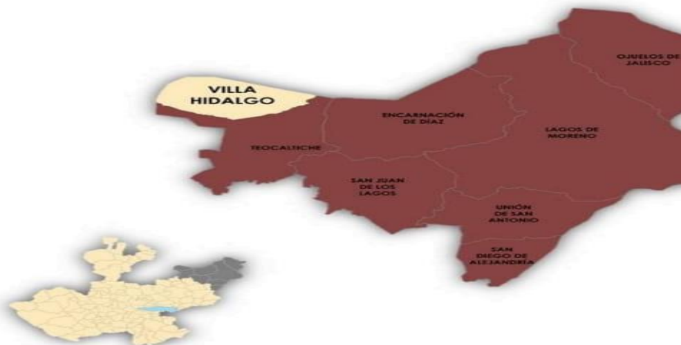
Figura 1. Villa Hidalgo, Jalisco. Localización geográfica.